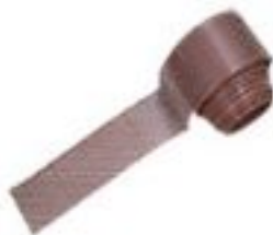
Вентиляционная лента против птиц