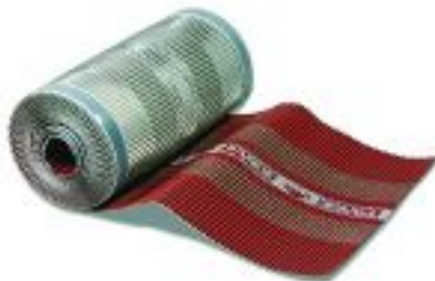
Вентиляционный пояс Ал