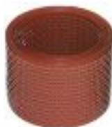
Вентиляционная лента против птиц