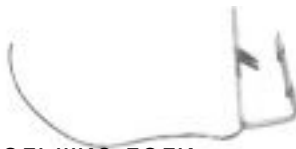
Скоба для штампованной черепицы - небольшие доли