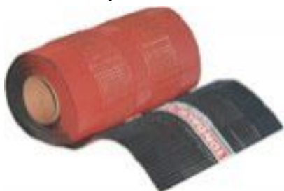
Вентиляционный пояс металлич.